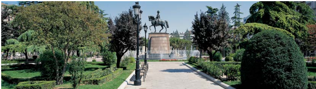
Jardines del Espolón

En esta ruta los estudiantes tendrán la posibilidad de realizar compras a la vez que van descubriendo a su paso la esencia cultural de la capital riojana. La ciudad cuenta con varias zonas comerciales, pero la más singular y característica es la situada dentro de la zona más turística, que se corresponde a su vez, con las calles más antiguas de Logroño.