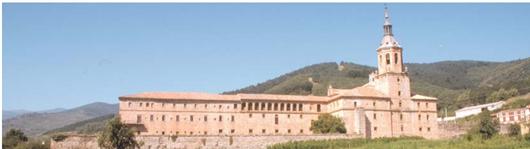
Monasterio de Yuso

La Rioja es rico albergue de esos sagrados refugios de espiritualidad que son los monasterios. Surgidas, en su mayoría, en la Edad Media, estas instituciones son fundamentales para comprender la historia de La Rioja. Este circuito incluye la visita a los siguientes monasterios: Monasterio de la Piedad, en Casalarreina, Monasterio de Santa María la Real, en Nájera, Monasterio de Yuso y Suso, en San Millán de la Cogolla, y el Monasterio Cisterciense de Santa María del Salvador, en Cañas.