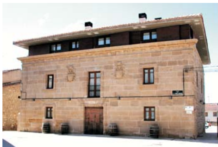
Hotel Villa de Ábalos