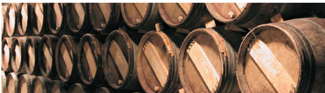
Barricas en bodega

La cocina que se desarrolla a partir de recetas tradicionales, sencillos platos que han sabido conservar todo el sabor de la gastronomía tradicional. Patatas con chorizo, menestra, chuletillas al sarmiento, pimientos rellenos, legumbres, embutidos, carnes a la brasa, caracoles y un largo etcétera de menús que nos devolverán unos sabores que poco a poco se van perdiendo de nuestra memoria y que aquí alcanzan la categoría de manjar.