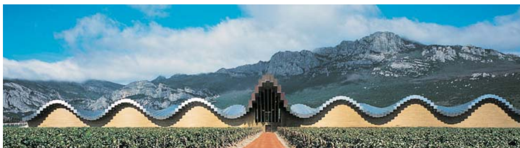
Bodega de Rioja

La Rioja es una tierra de exuberante belleza natural, salpicada de viñedos y bodegas, en muchos casos, de gran riqueza arquitectónica y con posibilidad de ser visitadas. Se realiza un recorrido por sus instalaciones para ver todo el proceso de elaboración del vino. La bodega, además, puede ofrecer cata de vino y la posibilidad de degustar platos típicos de la amplia y variada cocina riojana.