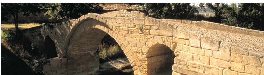
Puente romano, siglo II

Arte y cultura que se suceden en una continua superposición de acontecimientos y estilos que nos permitirán ir desentrañando el pasado paso a paso, sumergiéndonos en la aventura de la historia de La Rioja.