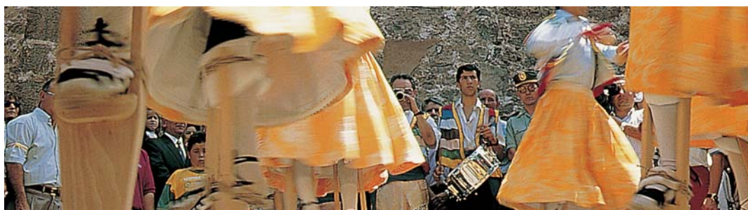
Danzadores de Anguiano

En tierras de vino no podían faltar fiesta en las que este don de la tierra fuera el protagonista. La Batalla del Vino de Haro o la del clarete de San Asensio son buen exponente de ello. Y las fiestas de san Mateo, "Fiesta de la Vendimia", fiestas grandes de Logroño en la que la alegría se desparrama por las calles durante una semana de algarada y espectáculos.